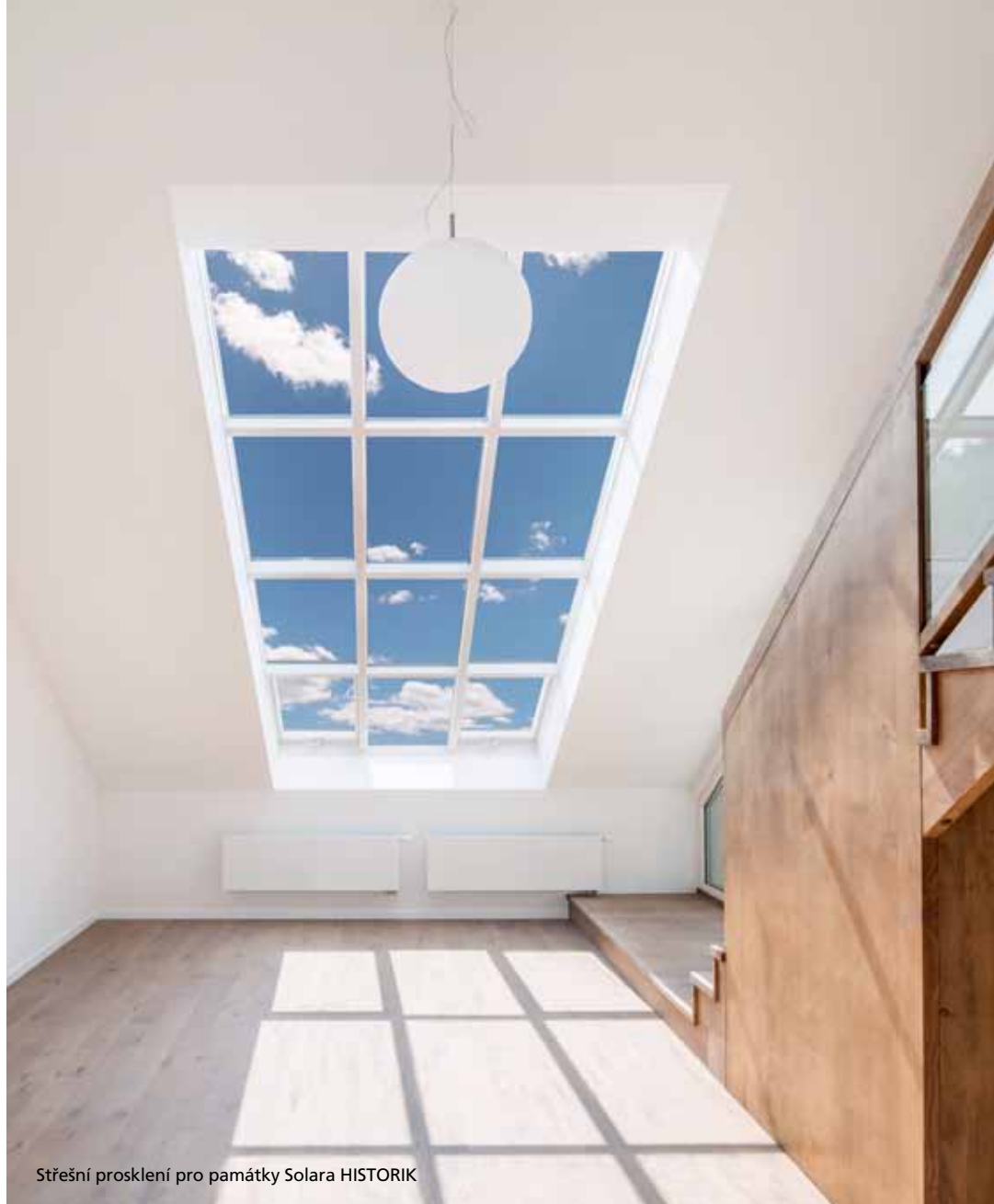
Střešní prosklení pro památky Solara HISTORIK