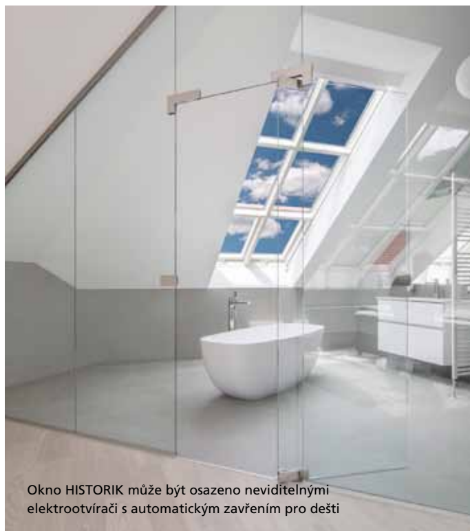
Okno HISTORIK může být osazeno neviditelnými elektrootvírači s automatickým zavřením pro dešti